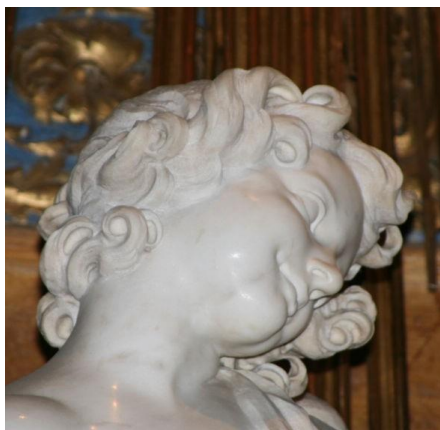
Figura 4 - A imagem mostra um detalhe da escultura “O Êxtase de Santa Teresa” (1645–1652), de Gian Lorenzo Bernini, feita em mármore e localizada na Igreja de Santa Maria della Vittoria, em Roma. A obra representa o momento mítico em que Santa Teresa d’Ávila descreve ser tomada pelo amor divino em uma experiência espiritual intensa, traduzida por Bernini em expressões corporais e faciais de êxtase e transcendência.

Fonte: Bernini, Gian Lorenzo. O Êxtase de Santa Tereza, 1645-1652. Mármore, 11,6 x 3,6 m. Igreja de Santa Maria Della, Roma. Foto: Blogger - Fora de mim. Elza Tamas.