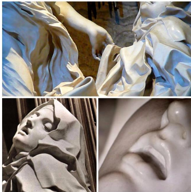
Bernini, Gian Lorenzo. O Êxtase de Santa Tereza, 1645-1652. Mármore, 11,6 x 3,6 m. Igreja de Santa Maria Della, Roma.

Figura 2 - Detalhes da escultura O Êxtase de Santa Teresa A imagem apresenta detalhes da escultura O Êxtase de Santa Teresa, de Gian Lorenzo Bernini, evidenciando a delicadeza dos traços, o movimento das vestes e a expressividade do rosto da santa. Esses elementos ressaltam o domínio técnico do artista e a característica emocional e teatral do estilo barroco, transmitindo intensidade espiritual e um sutil aspecto de sensualidade na representação da experiência mística.